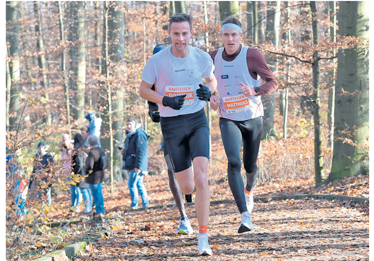
Klein bis Gross absolviert die unterschiedlichen Distanzen des Steinhölzlilaus durch Wald und Quartier.

LIEBEFELD – Bereits zum 35. Mal lockt der Steinhölzlilauf zu einem «Happening» gegen Jahresende. Das Familiäre, die abwechslungsreiche Strecke sowie das breite Angebot sorgen für einen besonderen Laufevent.